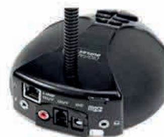
Digital Duplex 2X5T/ G S1PL ( с записью)