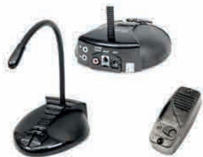
Digital Duplex 205T/ Digital Duplex 215T