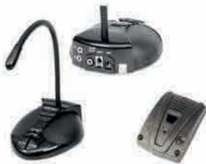
Digital Duplex 205G/ Digital Duplex 215G